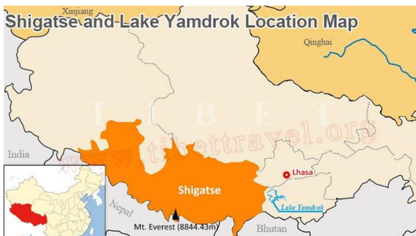
Afb 4: Shigatse, Tibet

Lhasa kunnen we zeker gaan bezoeken, alsook Shigatse. De Mount Everest kunnen we tegenwoordig wel overvliegen in plaats van deze te moeten beklimmen. Waarom moeilijk doen als het makkelijk kan, niet waar?