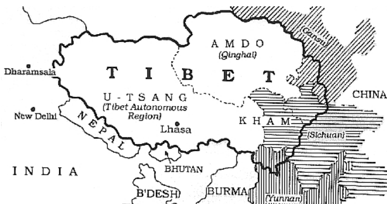
Afb. 3 : Lhasa, Tibet.

De volgende stap is dan de uiteindelijke reis aanvatten naar Tibet.