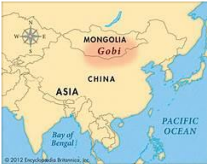
Afb. 7. De Gobi-woestijn in Mongolië, boven China gelegen.

Zou onze aanvankelijke Graalzoektocht ons daar doen belanden, het lijkt een onbegonnen werk. Maar we kunnen nu eenmaal niet meer terugkrabbelen.