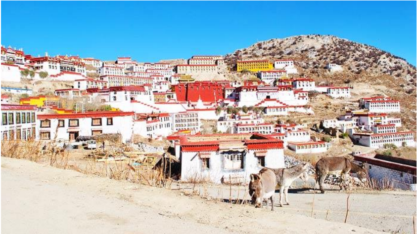
Afb. 8 : Het Ganden Klooster in Tibet, opgericht door Tsong-Kha-Pa 2

Tsong-Kha-Pa stichtte een prachtig Klooster in Tibet dat ik graag zou bezoeken. (Zie Afbeelding 8 ), het Ganden Klooster (Ganden betekent Vreugdevol).