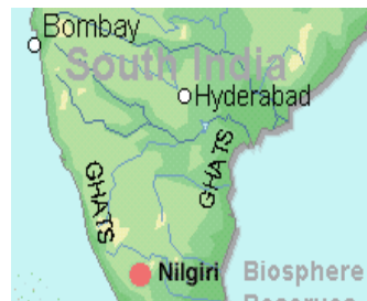
Afb. 2 : Nigiri Hills, India