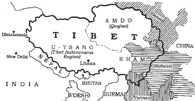
Afb. 3 : Lhasa, Tibet.

De volgende stap is dan de uiteindelijke reis aanvatten naar Tibet.