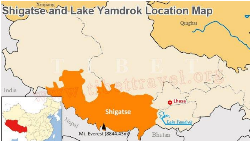
Afb 4: Shigatse, Tibet